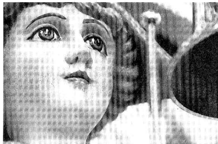
Detail van een draaiorgel.

Het boek 'Mansende Mannen' inclusief cd is voor 19,95 euro te koop bij de Leidse boekhandels of te bestellen via info@prokwadmaat.nl